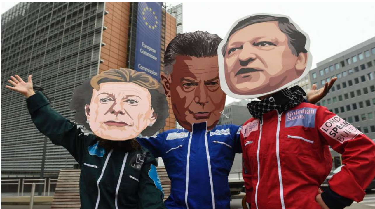
Protesta junto a la Comisión con los rostros de la excomisaria Neelie Kroes, el excomisario Karel De Gucht y el expresidente Barroso.