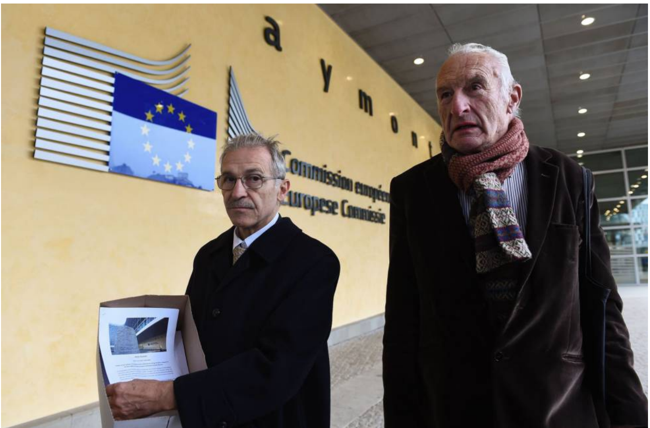
Antiguos funcionarios de la UE llevan a la Comisión las firmas pidiendo medidas contra Barroso. /JOHN THYS (AFP)

"Proporciona munición a aquellos que aseguran que el proyecto europeo solo sirve a los intereses financieros. Desacredita todo el trabajo de nuestra institución", señala con desaprobación la declaración impulsada por sindicatos y funcionarios. La marcha de los críticos con Barroso ha puesto después rumbo al Consejo, donde han entregado al responsable de Protocolo una carta para su presidente, Donald Tusk, y se dirigió más tarde a la Eurocámara, donde fueron recibidos por el presidente del Parlamento, Martin Schulz.